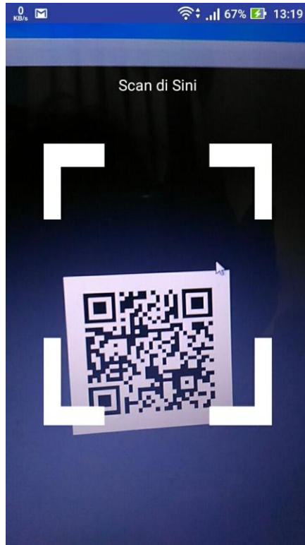
Figure 2 Scan QR Code

c. Setelah Memasukkan no uji atau scan QR code, Hasil Uji akan ditampilkan